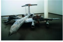
Kiefer s'attaque à la matière