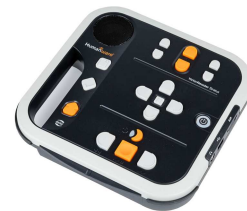
Victor Stratus M4