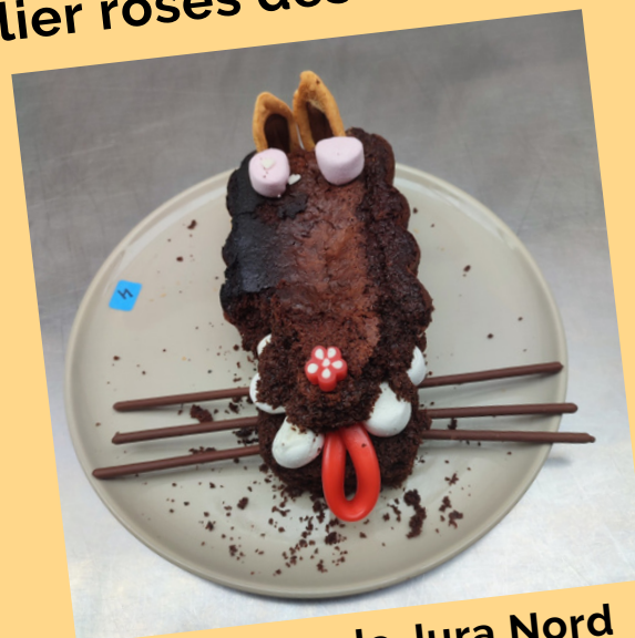
L'équipe de Jura Nord est gourmande !

Atelier roses des sables, concours de gâteaux de fête